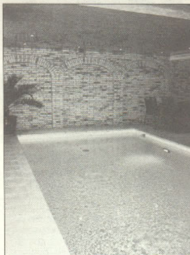
Das neue Schwimmbad im Gästehaus „Ullmannshof“.

Ein jeder weiß und kennt es, ein mit viel Ar-